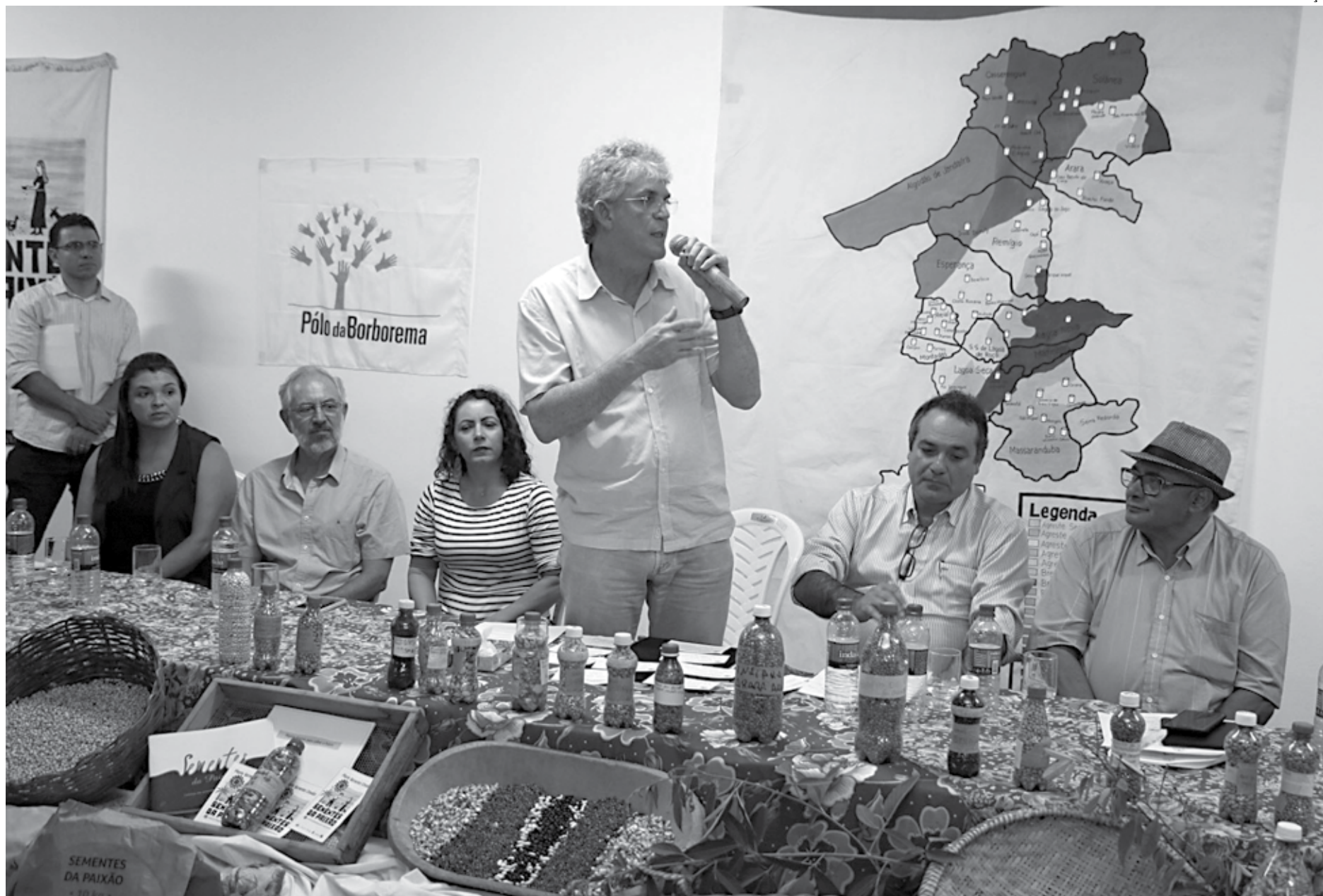
O governador destacou que o Banco de Sementes é muito importante porque vai agregar a produção de diversas comunidades, além de proporcionar condições mais adequadas para os agricultores