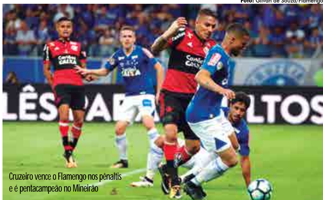
Cruzeiro vence o Flamengo nos pênaltis e é pentacampeão no Mineirão