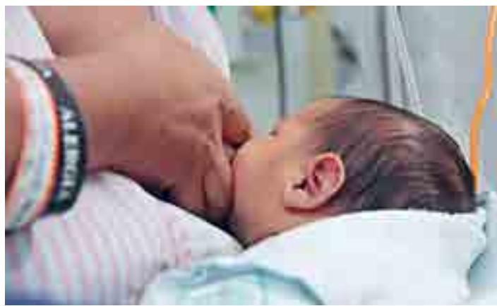
O bebê é colocado pele a pele com a mãe e chega a mamar na sala de parto.

A diretora ainda destacou que é importante a variedade, o equilíbrio e moderação alimentar durante o período gestacional. “A mamãe pode sim comer chocolate, tomar café e comer feijão, contudo, dentro de uma quantidade segura. É recomen-