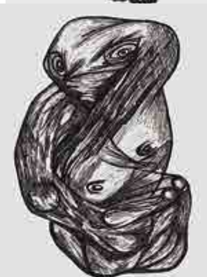
Desenhos criados em nanquim com linhas pretas, de autoria de Luiz Ricardo Sales, conhecido como 'Versales'