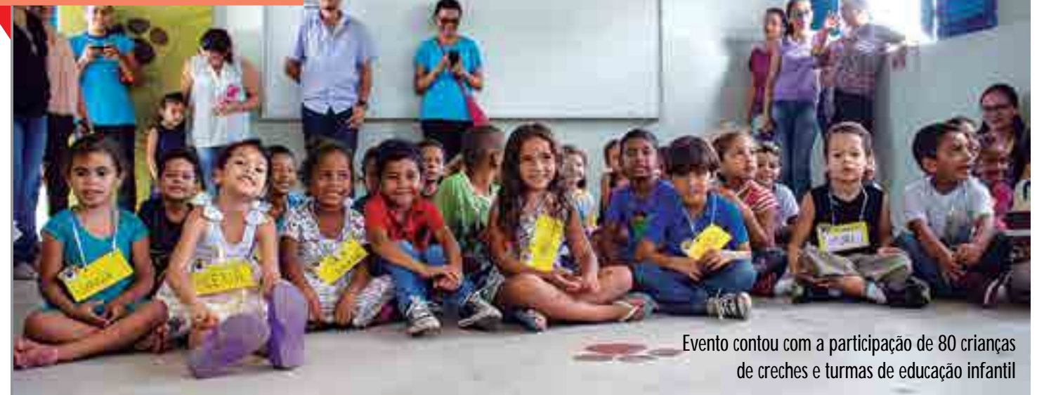
Evento contou com a participação de 80 crianças de creches e turmas de educação infantil