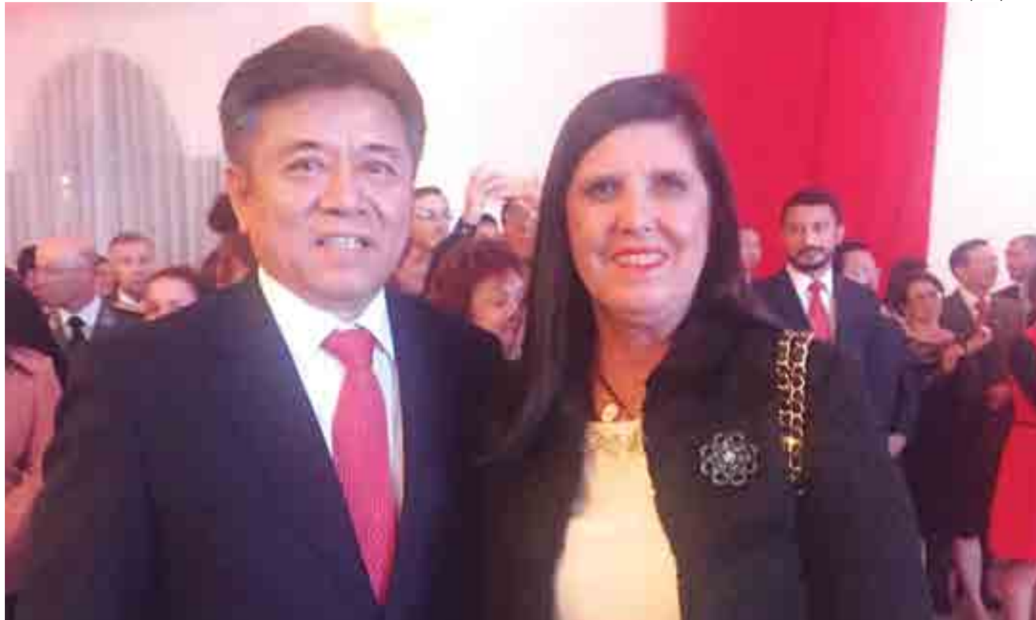
A vice-governadora Lígia Feliciano com o embaixador da China, Li Jinzhang, em evento na última terça-feira (26)