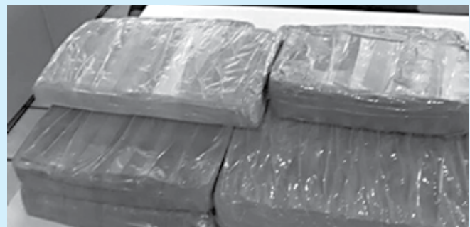
Além da cocaína, foram apreendidos mais 5 quilos de crack