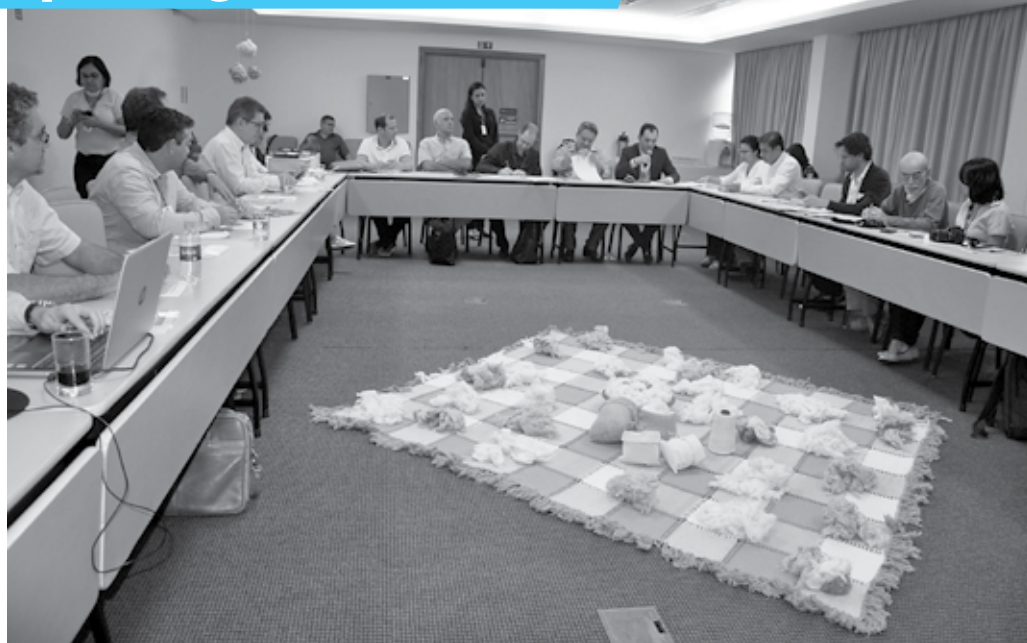
Órgãos e especialistas debateram estratégias e desafios da cadeia produtiva do algodão orgânico