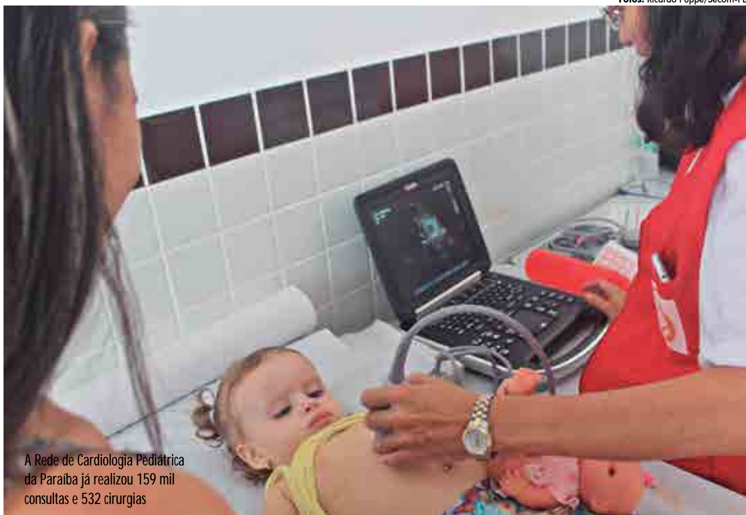
A Rede de Cardiologia Pediátrica da Paraíba já realizou 159 mil consultas e 532 cirurgias