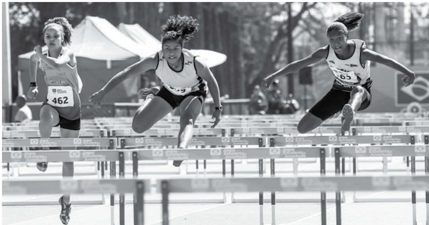
O atletismo é uma das modalidades beneficiadas que faz parte do projeto que visa descobrir novos talentos ao logo dos próximos três anos