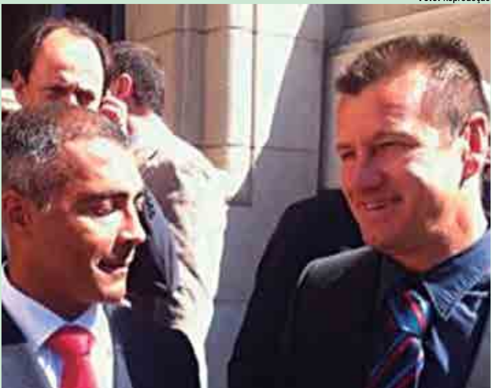
Romário alegava na ação que Dunga teria denegrado a sua imagem e perdeu em duas instâncias